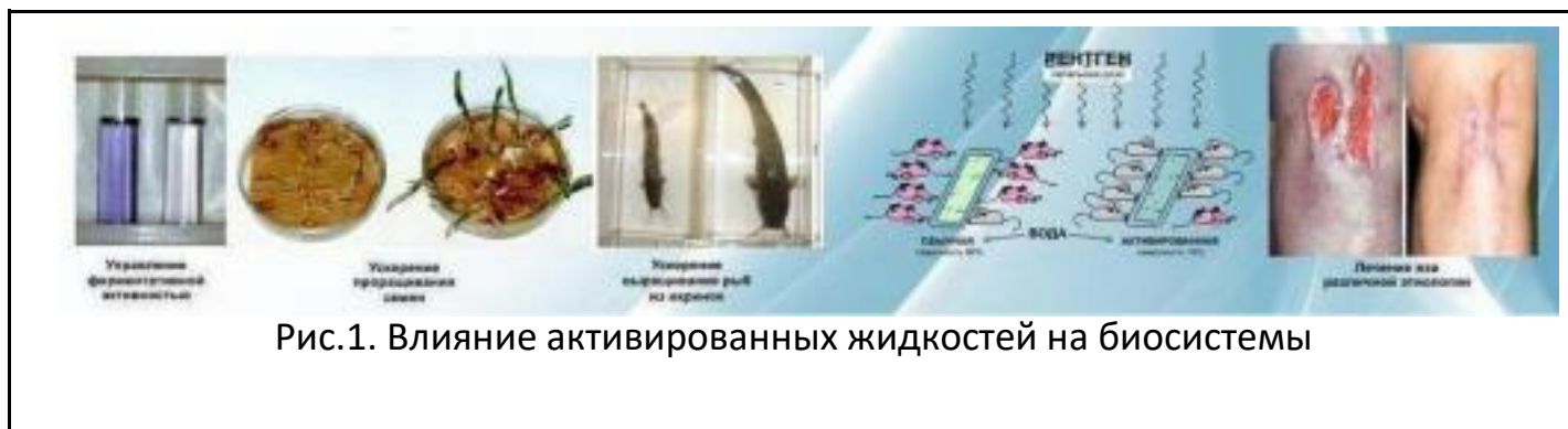
Рис.1. Влияние активированных жидкостей на биосистемы

Проводятся международные конференции, имеются научные исследования и практическое применение в медицине.